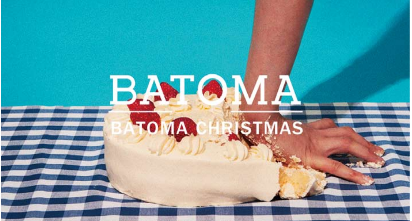
※「場と間 vol.08 BATOMA CHRISTMAS」キービジュアル

アッシュ・ペー・フランス株式会社 場と間 が主催する、日本で唯一のクリスマスに特化した合同展示会「場と間 vol.08 BATOMA CHRISTMAS (場と間クリスマス)」を、2015年5月29日(金)・30日(土)の2日間、ラフォーレ原宿6階 ラフォーレミュージアム原宿にて開催します(27日・28日はビジネスのための招待制)。クリスマスシーズンに屋外で開催されるニューヨークのホリデーマーケットのような空間には、デコレーションアイテムやインテリア雑貨、グロサリーなど、クリスマスだけでなく、家族や友人、恋人へのギフトにもぴったりなアイテムが揃います。出展者数は、過去最多の計47社！日本初上陸のチョコレートドリンクや、人気インテリアブランドから初披露されるジュエリーライン、展示会に初出展するポर्टランド発のグリーティングカードなど、ここでしか出会えないアイテムも多数登場します。各ブースでは、メーカーと対話しながらバイヤー気分で買い物を楽しめます(一部除外あり)。また、毎回話題を呼ぶインスタレーションでは、時代を経て消滅しつつある技術を現代のデザインで再構築したネオンアートを紹介。会場内に登場する楽しいフォトスポットと共に、訪れる人の感性を刺激します。「場と間」が提案する“あたたかいクリスマス”をお楽しみください。